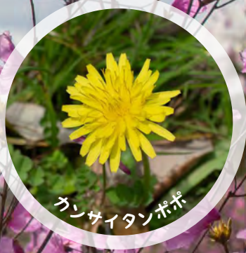
カンサイタンポポ