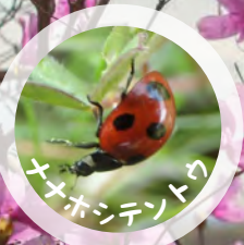
メナホシテントウ