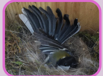
毎日あたためます…！