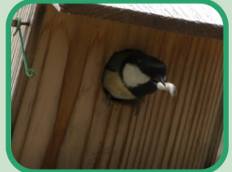
ヒナのファンそうじ！