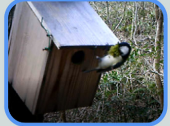
巣材をたくさん運ぶ！