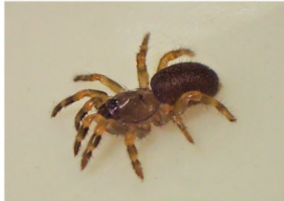
↓森で見つけたキノボリトタテグモ

僕はクモと昆虫(とくに甲虫)が大好きです。クモも昆虫も嫌われていることが多いですが、摩訶不思議な暮らしをしている種類もたくさんいるので、皆さんに観察のおもしろさを伝えていきたいと思っています。僕はまだこの生きものことはほとんど知らないなので、これから学んでいきたいです。活気が出てきた生きものたちとともに僕も元気よく駆け出していきますので、どうか応援よろしくお願いいたします。(みがるん)