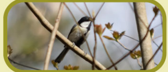
オスはエサ探しとみはりをします