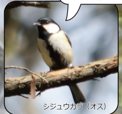
シジュウカラ (オス)

これはシジュウカラの卵です。7~8個ほど産んでから、同時に温めます。子育てはほぼメスの仕事です。オスは外でエサ探しやみはりします。