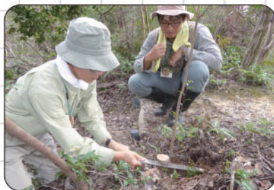
②あれ？幹の中には何もいない？