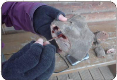
④根を切って中を調べると…。