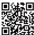
↑泉北ラップのQRコード