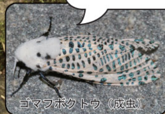
ゴマフボクトウ (成虫)

この赤くて丸いものは私の幼虫のフンです。幼虫は木の中を食べながら過ごしています。