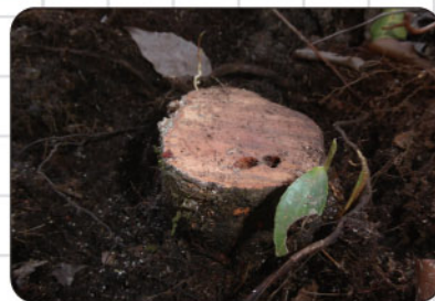
③根のあたりでようやく穴を発見！