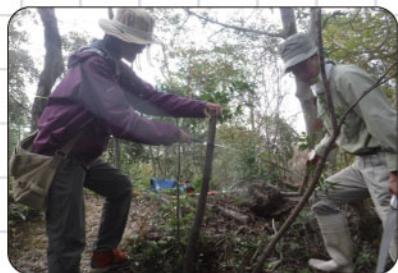
①木を切って幹の中を調べます。

台風で倒れた木を片付けていると、木の根元に赤くて丸いものを発見。本で調べると「木の中で暮らす昆虫（幼虫）が出したフン」らしいけど詳しいことはあまり書かれていない。これは、自由研究のチャンス！