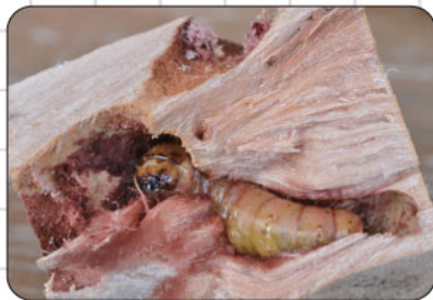
⑤大きな幼虫が見つかりました！