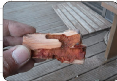
⑥根の中はまるで迷路のよう！

図鑑で調べてみると、「ゴマフポケットウ」というガの仲間であることが分かりました。実際に調べてみると根の中で暮らしていること、一本の木に数匹いることが観察できました。みんなも調べたいことがあったらレンジャーに相談しにきてね！