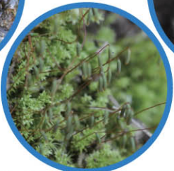
コバノチョウチンゴケ