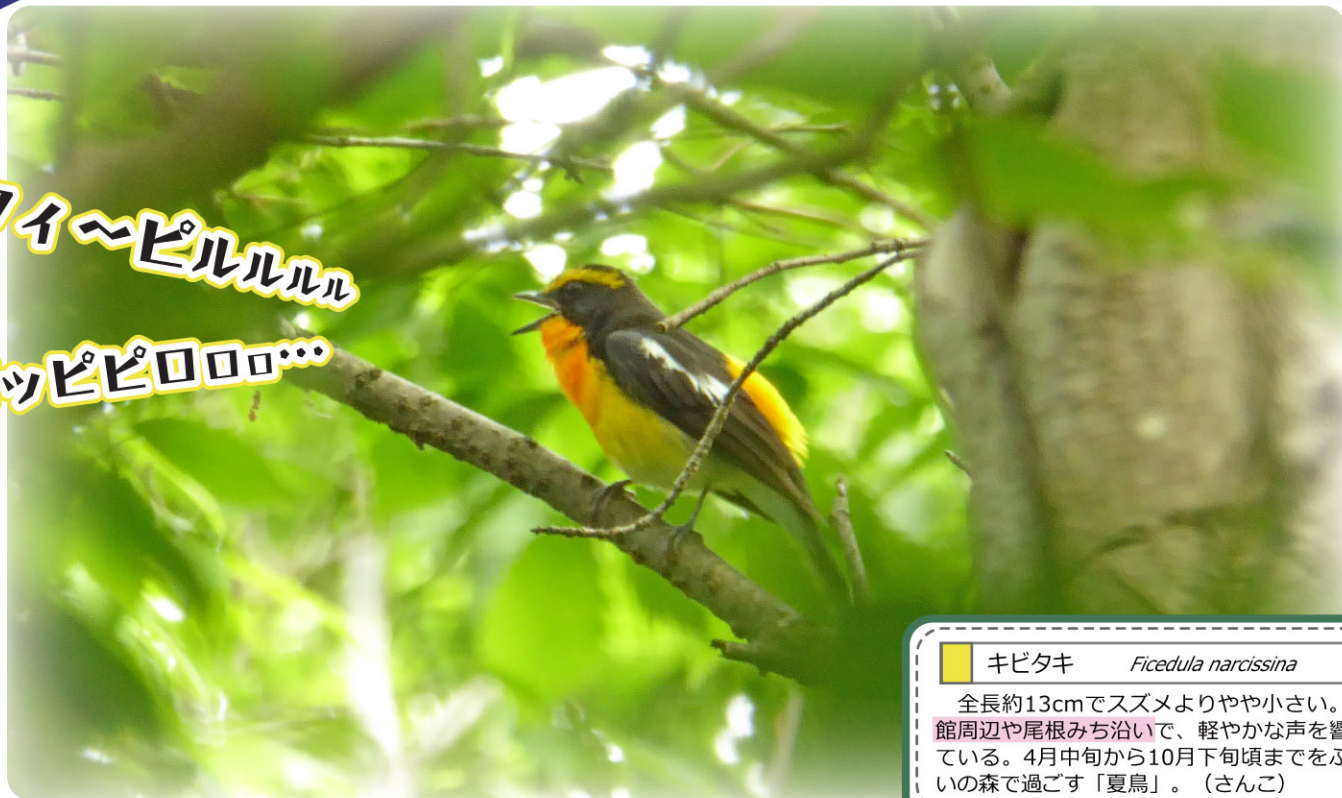
キビタキ Ficedula narcissina

全長約13cmでスズメよりやや小さい。森の館周辺や尾根みち沿いで、軽やかな声を響かせている。4月中旬から10月下旬頃までをふれあいの森で過ごす「夏鳥」。(さんご)