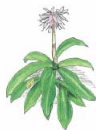
ショウジョウバカマ

春が近づくと様々な草花たちが花を咲かせ、春のおとずれを知らせてくれます。今回は南部丘陵地において春を感じさせてくれる草花を紹介します。