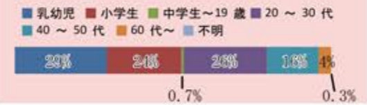
ふれあいの森の利用者の内訳

当施設の利用者の多くは、乳幼児や小学生とその保護者の方です。大人の方だけのグループや個人での利用はまだ多いとは言えません。幅広い年齢層の方にご利用頂く事を旨とし、教員対象の研修会、大人限定の観察会の開催、市民団体の受入、大学実習生の受入、堺市が主催する事業との連携等を行っています。今後も、より多くの方にご利用頂けるよう、来園者のニーズを把握し、質および満足度の高い企画を実施していきます。