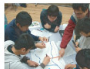
▲ グループ学習の指導