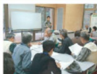
▲ 観察と合わせた講習