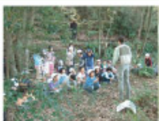
▲ 森の仕組みの解説

●学校の遠足や校外学習の他、大人向けの自然観察や講義・研修の受入も実施しています。既存のプログラム以外にも目的に合わせたプログラムを作成・実施いたしますので、ご相談下さい。