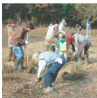
▲ ススキ移植活動体験