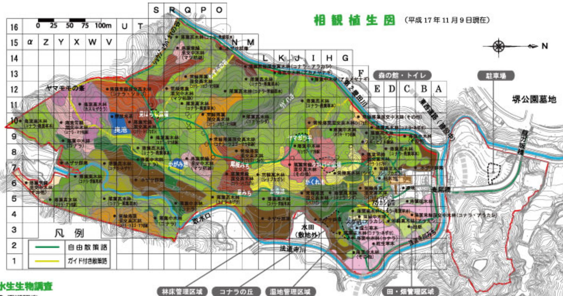
相観植生図 (平成17年11月9日現在)