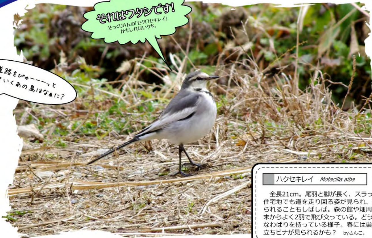
ハクセキレイ Motacilla alba

全長21cm。尾羽と脚が長く、スラッとした印象。住宅地でも道を走り回る姿が見られ、来館者に尋ねられることもしばしば。森の館や畑周辺では、昨年未からよく2羽で飛び交っている。どうやらつがいでなわばりを持っている様子。春には巣材運びや、巣立ちピナが見られるかも? byさんこ。