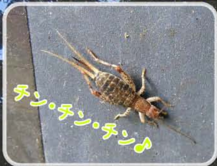
カネタタキ 6.8~11mm (カネタタキ科)

木の上で生活する鳴く虫。姿を見ることがはまれ。「チン・チン・チン」と鐘を叩いたような声で鳴く(写真はメスなので鳴きません)。