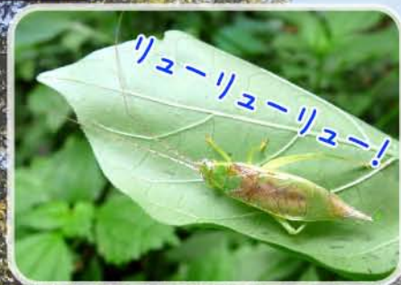
アオマツムシ 21~23mm (マツムシ科)

季節が変わり、ふれあいの森では鳴く虫達の音楽会が開催中です。今回は、コナラの丘で見られる鳴く虫の一部を紹介します♪