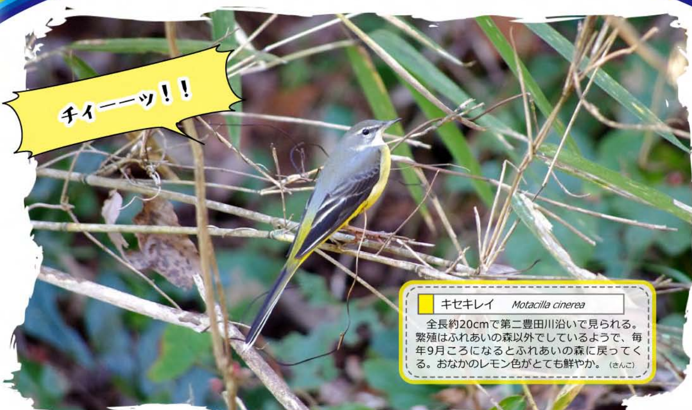
キセキレイ Motacilla cinerea

全長約20cmで第二豊田川沿いで見られる。繁殖はふれあいの森以外でしているようで、毎年9月ころになるとふれあいの森に戻ってくる。おなかのレモン色がとても鮮やか。(さんご)