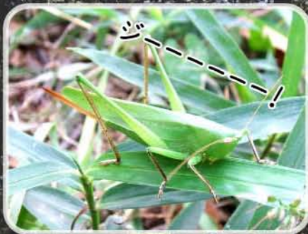
クサキリ 37~47mm (キリギリス科)

木の上で生活するマツムシの仲間。「リュ-リュ-リュ-」と高く大きな声で鳴く。中国から渡来した外来種。