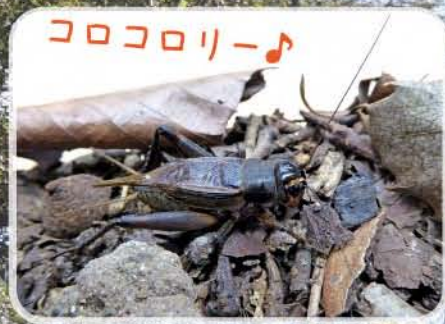
エンマコオロギ 28~35mm (コオロギ科)

草むらで生活する小さな鳴く虫。小さく自立できないが、草むらをよく観察すると見つかる。「ジ~~~~」と小さな声で鳴く。