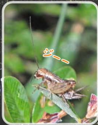
シバズ 6.1~6.7mm (ヒバツモドキ科)

草むらで生活するキリギリスの仲間。草が茂った場所で見つかることがある。「ジ~~~~」と力強く鳴く(写真はメスなので鳴きません)。