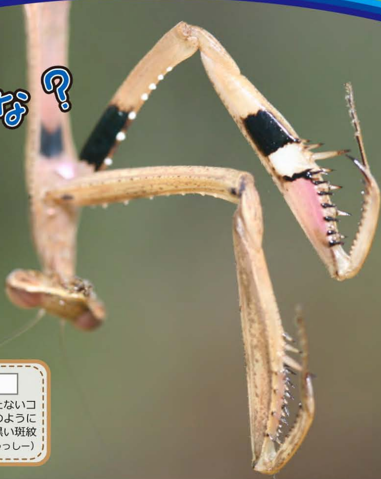
カマキリ Statilia maculata

成虫になっても大きさが6cmにも満たないカマキリですが、獲物を狩るために鎌のように変化した前脚の内側にはキリリとした黒い斑紋が見えます。(うっしー)