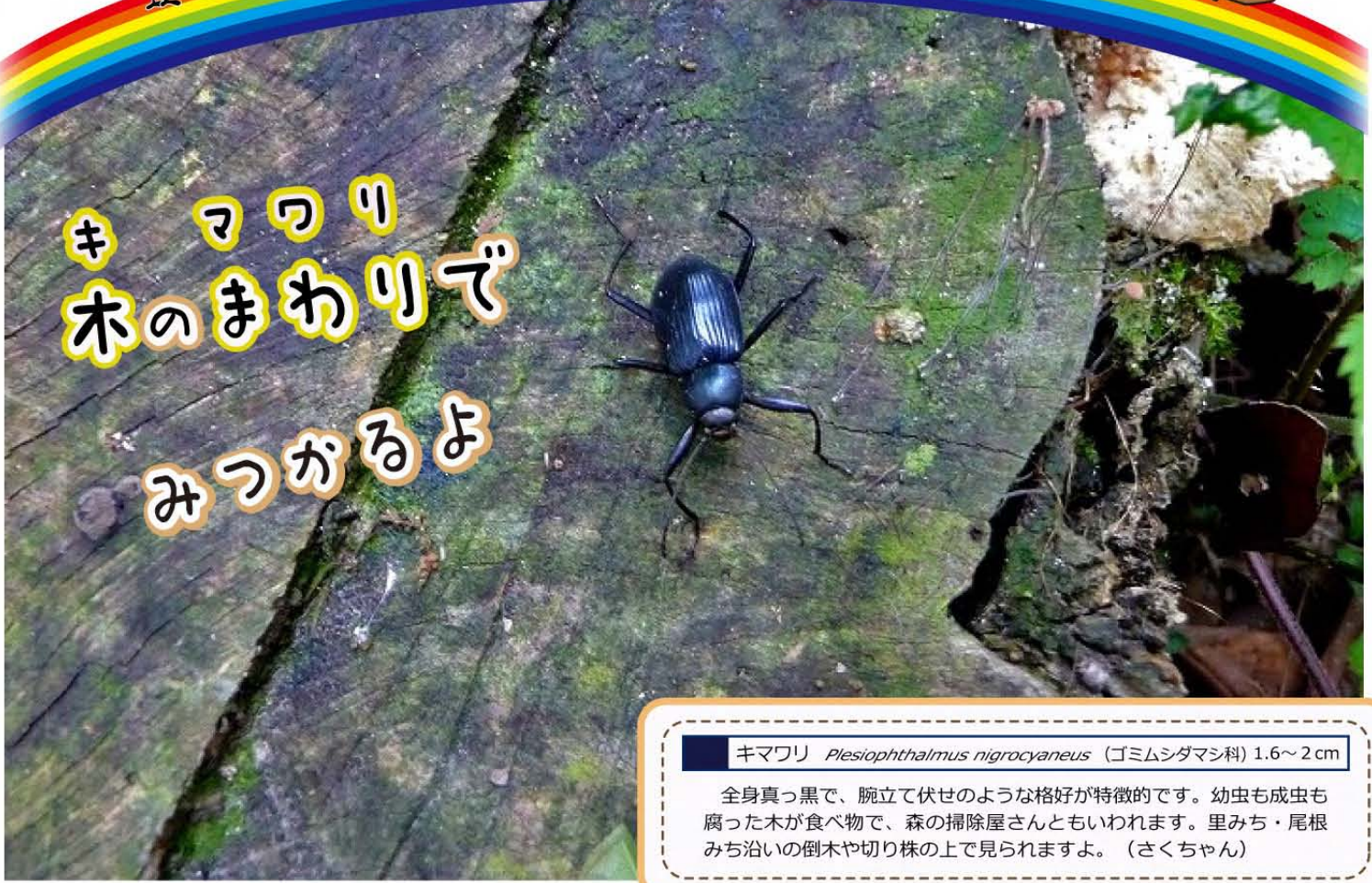
キマワリ Plesiophthalmus nigrocyaneus (ゴミムシダマシ科) 1.6~2 cm

全身真っ黒で、腕立て伏せのような格好が特徴的です。幼虫も成虫も腐った木が食べ物で、森の掃除屋さんともいわれます。里みち・尾根みち沿いの倒木や切り株の上で見られますよ。(さくちゃん)