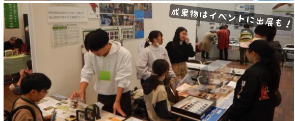
成果物はイベントに出展も！