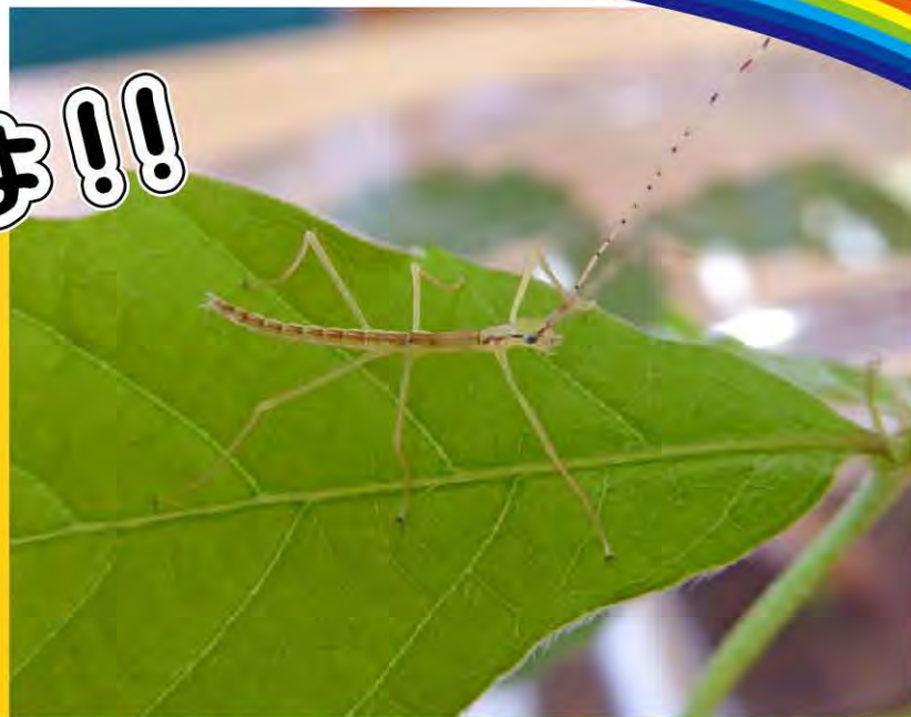
ヤスマツトビナナフシ Micadina yasumatsui

コナラやノイバラなどの葉を食べる、ふれあいの森では最も多く見られる、羽のあるナナフシの仲間。生まれたての幼虫の体長は約1cm、成虫は約5cm。野外では、幼虫は4月ごろから、成虫は6月から10月ごろに見られる。写真はふ化する瞬間～ふ化直後の幼虫。室内で保管していた卵が3月3日にふ化し、ドングリから育てたコナラの新芽を与え飼育・展示中。累代飼育は今年で3年目！（さんこ）