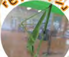
ツクムシ科 ツクムシ