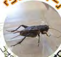
コオロギ科 エンマコオロギ