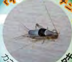
カネタタキ科 カネタタキ