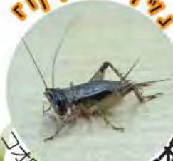
コオロギ科 ミツカドコオロギ