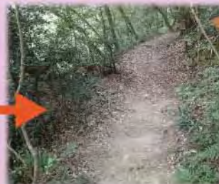
東のおじいさんの木