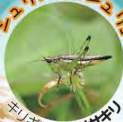
キリギリス科 ササギ