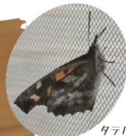
タテハチョウ科 テングチョウ