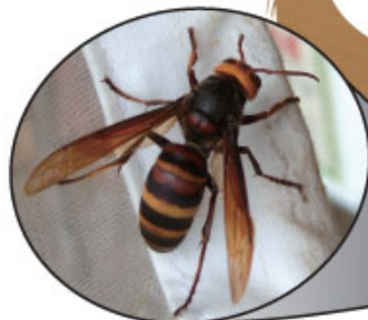
スズメバチ科 ヒメスズメバチ