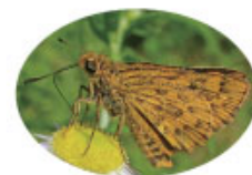
セセリチョウ科 キマダラセセリ