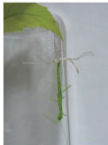
←脱皮中のトビナフシの仲間