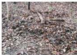
↓イノシシの掘り返し跡

先まで硬い骨で覆われています。そのおかげで、鼻先をシャベルのようにして土を掘ったり、石や木をどけてその下のごちそうを食べることが出来ます。どんなイノシシ?どこから来たの?色々想像しながら森を歩くのは楽しいですよ。(きのっち)