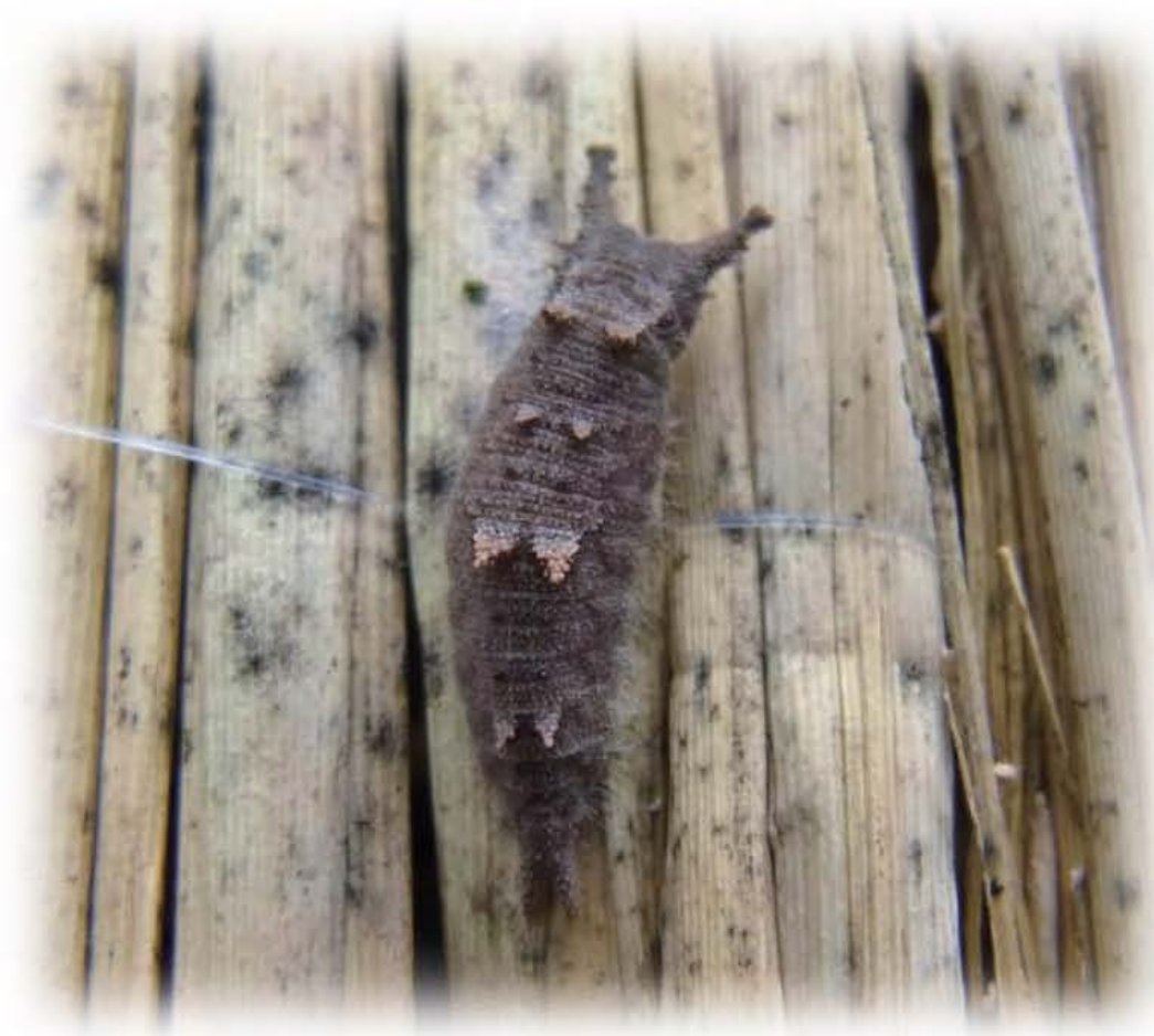
ゴマダラチョウの幼虫

寒い寒い大寒の日、エノキに巻いておいたつら をはずしてみました。いました！ゴマダラチョウ の幼虫です。