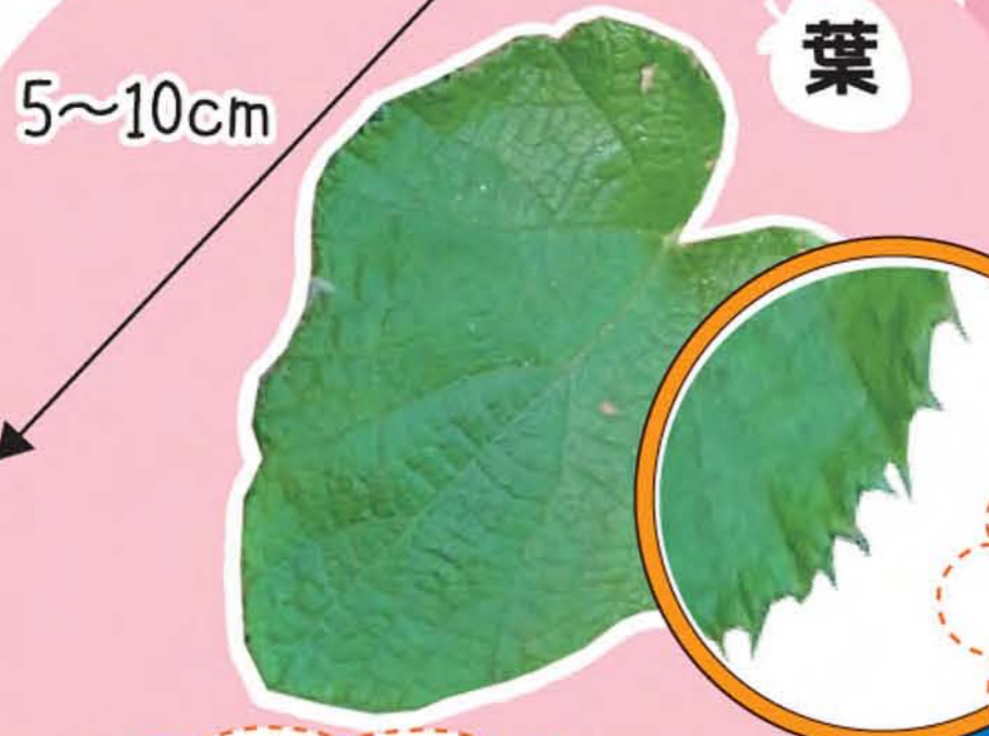
丸みを帯びたハート形の葉