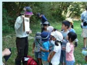
参加者は森の生きものや植物とふれあいました。

2006年の開園以降、来園者数 が20万人に達成したことを記念 して、イベントを開催しました。 記念品の贈呈や木の枝やタネを使 ったクラフト、ガイドウォーク (幼児向け・一般向け)を行い、