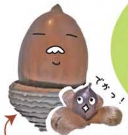
オキナウラジロガシ