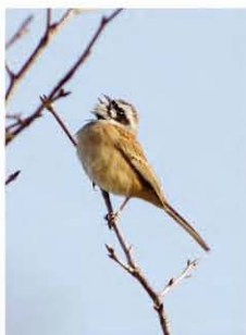
「さえずりするホオジロ

さて、森では様々な「春」を感じることができますが、その中でも私が一番気になるのが「さえずり」。鳥の声です。鳥の美しい声、という意味で使われることもある「さえずり」という言葉ですが、鳥の声の種類としては「オスの、繁殖に関わる声」のことを指します。今年、森で一番初めに聞こえたのが