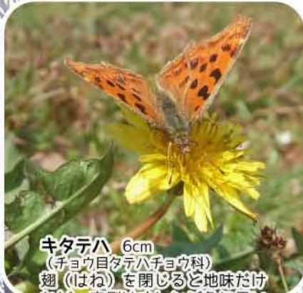
キタテハ 6cm (チョウ目タテハチョウ科) 翅(はね)を閉じると地味だけれど、内側はオレンジ色に黒いまだら模様がきれいだよ。花から花へひらひらと飛ぶよ。