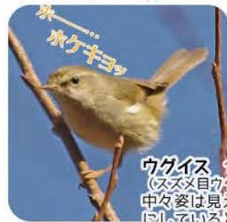
ウグイス 15cm (スズメ目ウグイス科) 中々姿は見えないけれど、静かにしているとホーホケキョッとさえずる声が聴こえるよ。