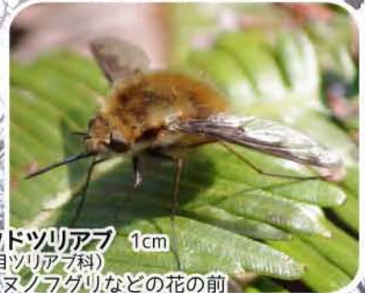
ピロドツリアブ 1cm (ハエ目ツリアブ科) オオイヌノフグリなどの花の前で待っていると、花のみつを吸いに現れるよ。ホバリスグをしながら器用にみつを吸うよ。