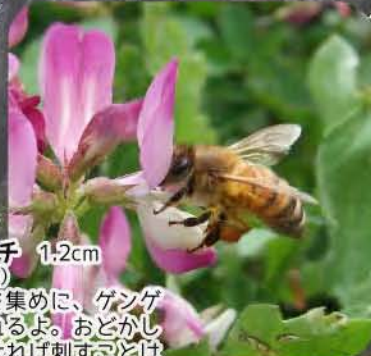
セイヨウミツバチ 1.2cm (ハチ目ミツバチ科) 花のみつと花粉を集めに、ゲンゲやナクハチを訪れるよ。おどかしたり、つかまなければ刺すことはないからそつと観察してみてね。