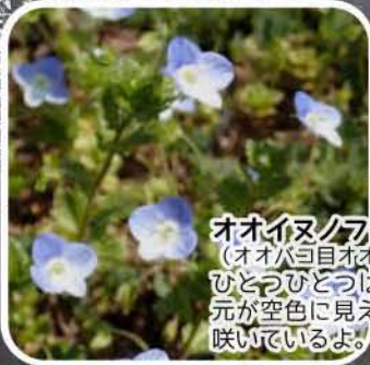
オオイヌノフグリ 1cm (花) (オオハコ目オオハコ科) ひとつひとつは小さいけれど、足元が空色に見えるくらいたくさん咲いているよ。