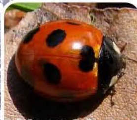
ナナホシテントウ 0.8cm (コウチュウ目テントウムシ科) 草むらでアブラムシを見つけたら近くに居るかも!? アブラムシを食べるよ。