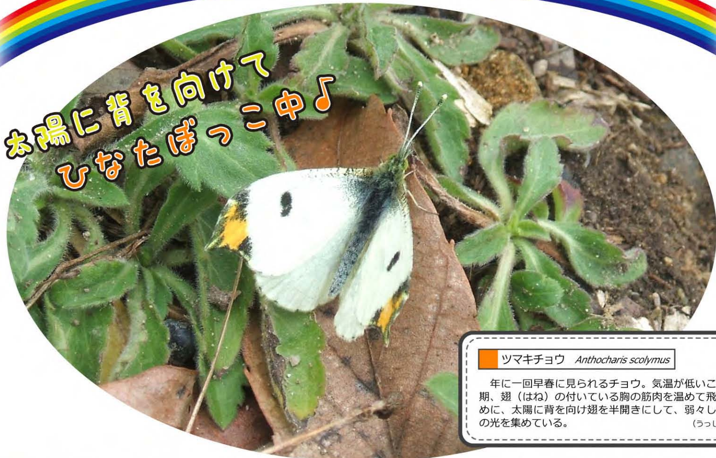
ツマキチョウ Anthocharis scolymus

年に一回早春に見られるチョウ。気温が低いこの時期、翅（はね）の付いている胸の筋肉を温めて飛ぶために、太陽に背を向け翅を半開きにして、弱々しい春の光を集めている。 (うっしー)